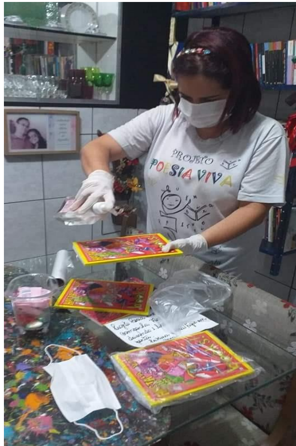
Preparação de kits para distribuição; higienização e embalagem.