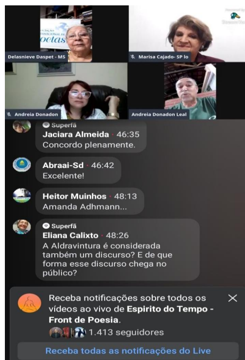
Conferência on-line . Arquivo pessoal da autora deste projeto.